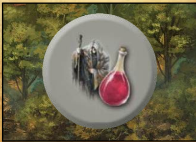
Nebelfeld „Trank der Hexe“

Thorald und Thorn oder Ein Abenteuer-Trip durch Andor