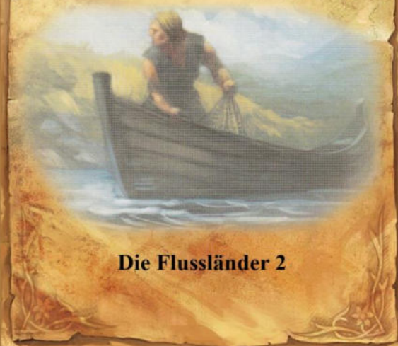
Die Flussländer 2

Der Hüter kann auf Feld 33 angegriffen werden, er hat 10 Stärkepunkte und würfelt mit einem weißen Würfel . Nur Brandur kann ihn angreifen, und nur ohne die Unterstützung anderer Helden oder Figuren. Durch eine verlorene Kampfrunde verliert er wie gewohnt Willenspunkte. Modifikatoren für mehr als 4 Spieler haben auf diesen Kampf keine Auswirkung.