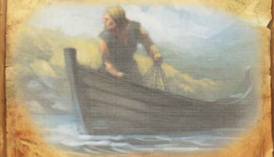
Die Flussländer 1

Kaum hatte er das kleine Dorf betreten, schon war Brandur von neugierigen Menschen umringt. Sie waren ausgemergelt und trugen einfache Kleidung. Sie berichteten von ihrem mageren Fischfang und von ihrer ständigen Angst vor den Trollen und lauschten aufmerksam seinen Worten von einem freien, einigen Land und einer geeinten Front gegen die Trolle. Doch plötzlich näherte sich ein fettleibiger Mann und scheuchte die Flussländer beiseite. Er stützte sich schwer auf seinen weißen Stab und sah Brandur aus blutunterlaufenen Augen an. „Verschwinde, Fremdling!“, keuchte er feindselig. „Ich bin der Hüter der Flusslande! Ich verteidige diese Menschen hier gegen alle Gefahren. Und du bist anders als wir. Also bist du eine Gefahr!“ Etwas leiser fügte er hinzu: „Ich kann hier niemanden brauchen, der große Reden schwingt und mir die Leute abspenstig macht. Hau ab oder ich mach’ dich kalt.“ Nachdenklich zog Brandur sich zurück. Eine junge Frau sprach ihn an, kaum dass er das Dorf verlassen hatte: „Bitte wartet! Mein Vater ist ein Tyrann! Er beutet die Flussländer aus, anstatt sie zu schützen. Helft uns, ihn loszuwerden, und wir werden Teil eures freien Landes!“ „Ihn loswerden? Wie genau?“ „Besiegt ihn im Zweikampf und zeigt den Menschen, dass er sie nicht beschützen kann. Oder überzeugt sie von Eurem großen Plan und bringt ihnen, was mein Vater ihnen nicht bieten kann.“