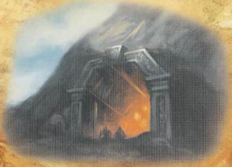
Die Schildzwerge 1

Brandur wurde von zwei grimmigen Zwergen empfangen und mit verbundenen Augen tief in den Berg zu einem Zwerg mit eiserner Krone und neugierigen blauen Augen geführt. „Ich bin Hallwort, der Große, Fürst von Cavern. Bist du der Anführer dieser abgerissenen Neuankömmlinge? Sag, was wollt ihr in meinem Land?“ „Eine neue Heimat!“, antwortete Brandur hoherhobenen Hauptes. Hallwort legte die Stirn in Falten. „Es wimmelt dort oben nur so von Trollen und anderen Kreaturen. Wenn ihr meint, dass ihr euch gegen sie zur Wehr setzen könnt, so dürft ihr hier siedeln und ein Protektorat der Schildzwerge werden. Doch...“ „Nein!“, unterbrach Brandur den Fürsten. „Wir sind die Freien. Unser ganzes Leben haben wir schon in Knechtschaft verbracht. Wir sind nicht den Fängen der Sklavenschinder entkommen und haben nicht einem Drachen getrotzt, um uns jetzt doch wieder zu unterwerfen. Wir wollen ein unabhängiges Land sein. Eure Verbündeten, nicht eure Untertanen.“ „Was war mit dem Drachen?“, fragte Hallwort erstaunt. „Ich selbst bin ihm entgegengetreten und konnte ihn mit der Macht der Sterne bezwingen.“ Brandur hob den reich verzierten Schild, und die Augen des Fürsten weiteten sich. „Der Sternenschild!“, hauchte Hallwort. „Also gut, Menschen: Ihr sollt euer unabhängiges Reich haben. Was nützt uns ein Land, in dem wir uns kaum an die Oberfläche wagen? Das Rietland soll euch gehören – wenn ihr uns dafür diesen Schild gebt!“