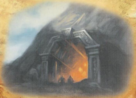
Die Schildzwerge 2

Brandur zögerte. Ohne diesen Schild hätte der Drache ihn getötet, und er fürchtete, ihn auch in den nächsten Tagen noch zu brauchen. Doch andererseits: Was war schon ein Stück Metall für ein ganzes Land? „Ich verspreche euch diesen Schild. Und zwar in einem Jahr. Bis dahin will ich ihn behalten und zum Wohle der Freien einsetzen. Was sagt Ihr, Fürst Hallwort?“ Der Zwerg lächelte. „Beweist mir, dass ihr den Kreaturen so lange standhalten könnt, und ich bin einverstanden!“