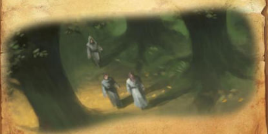
Die Bewahrer 3

Lest die Karte „ Die Bewahrer 3 “ jetzt noch nicht , sondern erst, wenn jeder Held einen Bericht abgegeben hat und Brandur wieder auf Feld 71 steht.