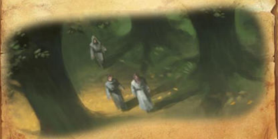
Die Bewahrer 2

„Und was unsere Obersten von euch Andori verlangen, kann ich euch verraten. Einen Schatz, den einem niemand nehmen kann, und der nur mehr wird, wenn man ihn teilt: Wissen! Berichtet uns über euch und eure Erlebnisse. Wir werden Schreiber schicken, die in der Nähe eure Berichte entgegennehmen.“ Der Bewahrer hob drohend seinen Bogen. „Und haltet euch vom Baum der Lieder fern, bis wir mehr von euch wissen.“