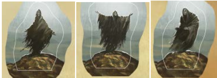
Drei Schwestern Markierer